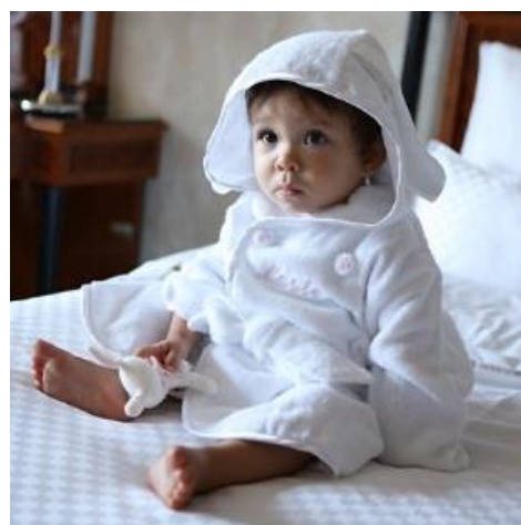
うさぎさんセット