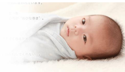
おひなまき (イメージ)

新生児をおくるみできつく巻きつける『おひなまき』（次頁参照）をすることにより、お母さんのお腹の中にいる状態に近付け安心感を与えることができ、夜泣きを改善するという意見もあります。『おひなまき』は生後6週間くらいまでの期間となりますが、この期間に「おくるみ=おねんね」という構図をつけてあげますと、成長してからの寝つきが良くなると言われています。